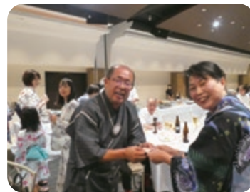
浴衣で参加の方へプレゼント