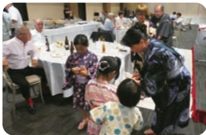
子どもたちへプレゼント