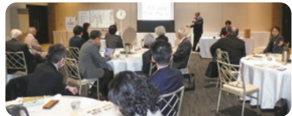
演題「人形峠環境技術センターの概要」