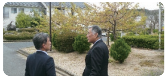
閉会后、会員は倉吉北高前庭の桜を鑑賞して、流れ解散